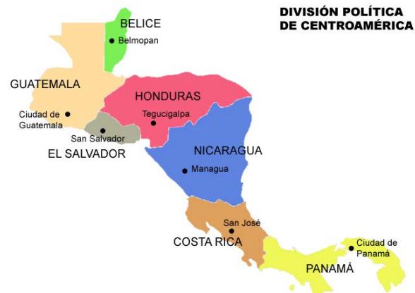
Figura 1. Mapa de Centro América