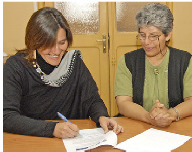
Firma convenio Guatemala- Chile (2010)